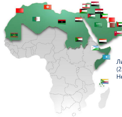
Лига арабских государств (22 страны). Нейтралитет 01.03.22

Налоги на прибыль, на дивиденды, НДС, иная налоговая нагрузка. Лицензирование. Особый налоговый режим. СЭЗ.